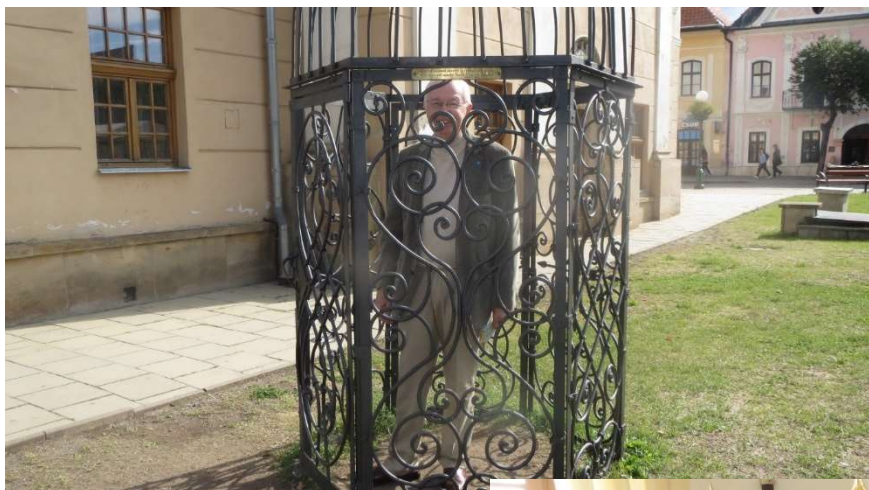
V Kežmarskej klietke (chvály).