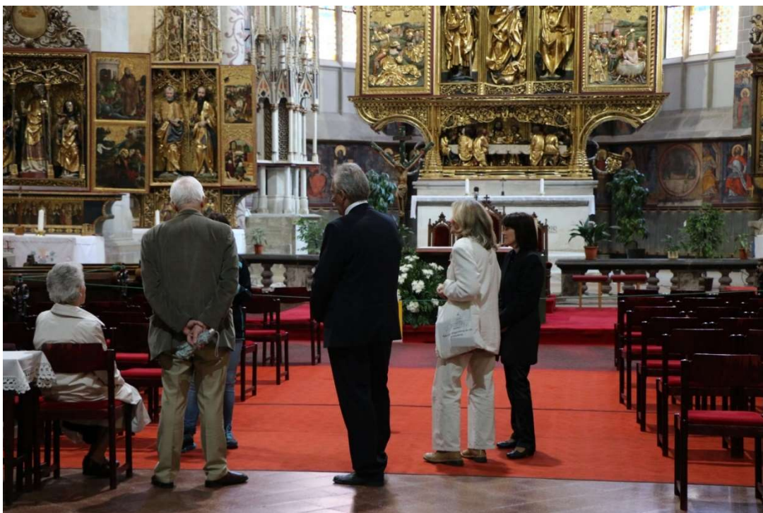
Pri prehliadke svetoznámeho oltára